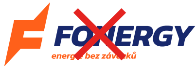
Změna proporcí jednotlivých částí