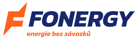
Logo + claim na světlém pozadí