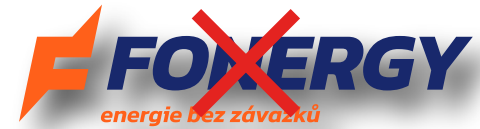
Přidávání nevhodných efektů