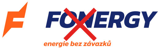
Nevhodné odsazení jednotlivých prvků