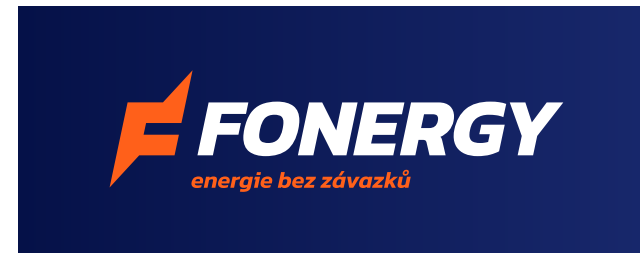
Logo + claim na tmavém pozadí