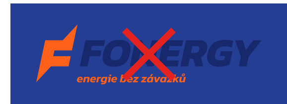
Malý kontrast pozadí s logem